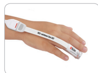
Pdt Applikation am Finger