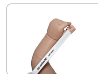
Inf Applikation am Daumen