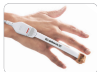
Neo Applikation am Finger für Erwachsene