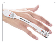
Adt Applikation am Finger