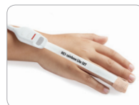
Inf Applikation am Finger