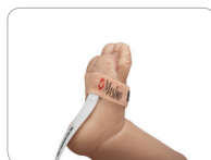
Neo Applikation am Fuß für Neugeborene